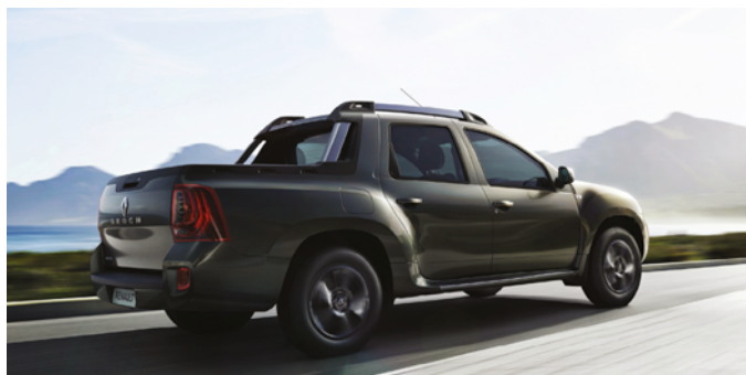
© Renault Marketing 3D – Commerce