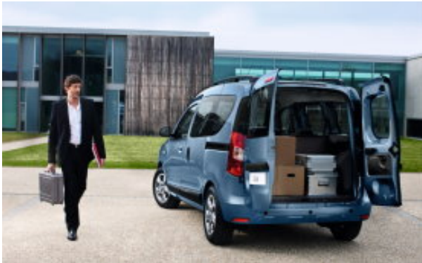
Dokker in Frankrijk