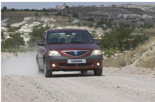
2004: Logan I © SAUTELET, Patrick