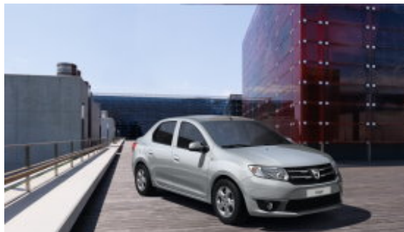
2014: Logan II

In 2014 viert Dacia de tiende verjaardag van Logan in Roemenië en zijn vijftiende verjaardag als onderdeel van de Renault-groep . Al sinds Logan in 2004 op de Roemeense markt kwam, kan het merk Dacia een parcours met een uitzonderlijk commercieel succes voorleggen: tot op vandaag verkocht Dacia al meer dan 2,7 miljoen wagens in Europa en het Middellandse Zeegebied. Sindsdien is het merk sterk gegroeid en werd het hele gamma vernieuwd: zo kan Dacia voortaan uitpakken met het jongste gamma van Europa .