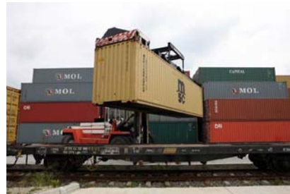
Het logistieke centrum van Mioveni.