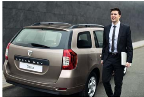
Logan MCV