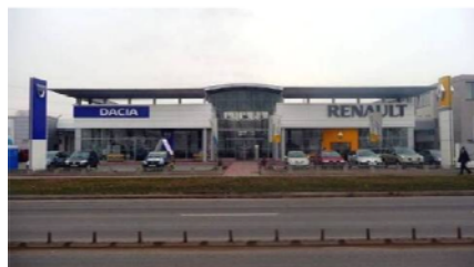
Dacia-netwerk in Roemenië

Renault België Luxemburg - Directie Communicatie