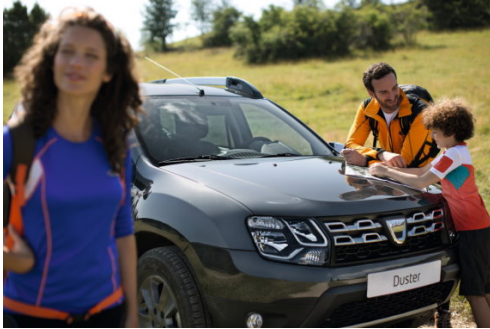
Nieuwe Duster