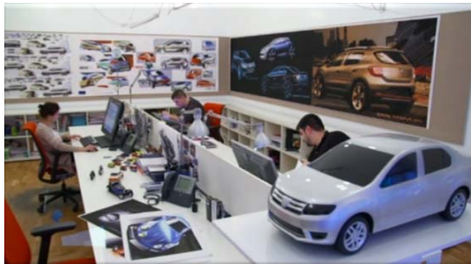
Het designcentrum van Boekarest

Renault België Luxemburg - Directie Communicatie Mozartlaan 20, 1620 Drogenbos Tel.: + 32 (0)2 334 78 51 – Fax: + 32 (0)2 334 76 18 Site : www.renault.be & www.media.renault.be