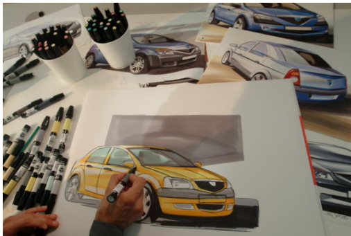
Designstudie Logan © STROPPIA, Philippe / Studio Pons

2004 Geboorte van Logan en commerciële lancering in Roemenië.