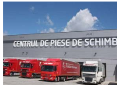
Het centrum voor wisselstukken in Oarja.

Renault België Luxemburg - Directie Communicatie Mozartlaan 20, 1620 Drogenbos Tel.: + 32 (0)2 334 78 51 – Fax: + 32 (0)2 334 76 18 Site : www.renault.be & www.media.renault.be