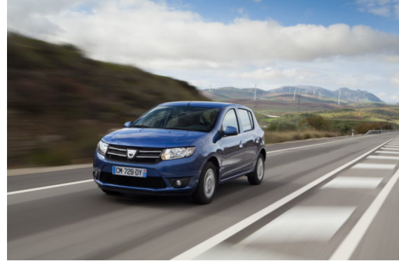
Sandero in Spanje © MEUNIER, Denis