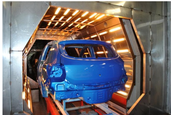
De fabriek voor koetswerkmontage in Mioveni.