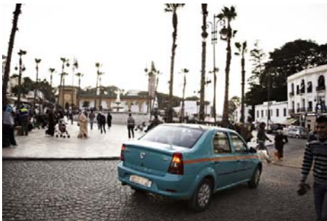
Logan in Tanger, Marokko