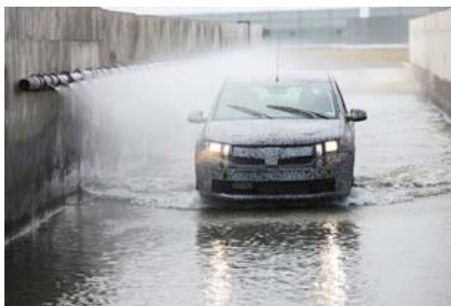
Circuit voor griptests