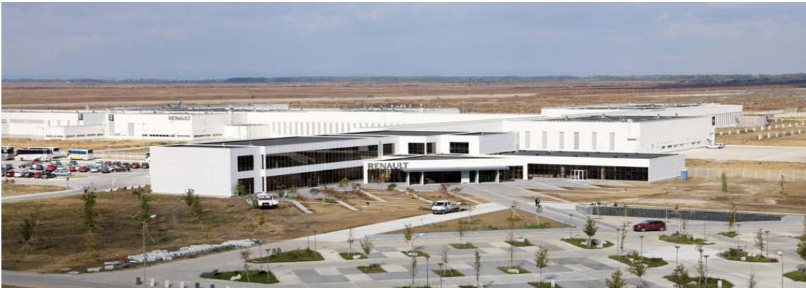
Het testcentrum van Titu