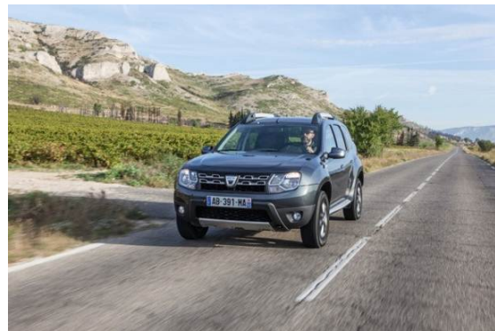
Duster in Frankrijk

Renault België Luxemburg - Directie Communicatie Mozartlaan 20, 1620 Drogenbos Tel.: + 32 (0)2 334 78 51 – Fax: + 32 (0)2 334 76 18 Site : www.renault.be & www.media.renault.be