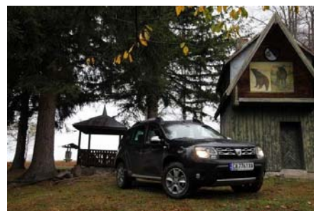
Nieuwe Duster in Bulgarije