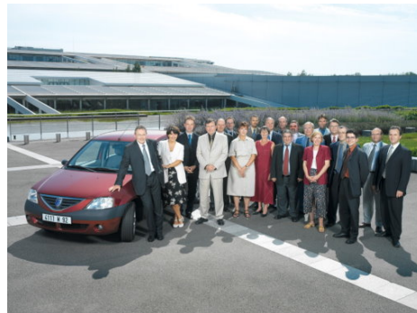
Het projectteam voor Logan © MILLIER, Sébastien / Architecten CHAIX en MOREL

Renault België Luxemburg - Directie Communicatie